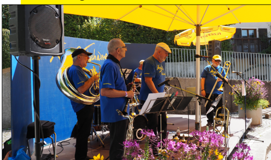
Die Imperial Jazzband sorgte zum Auftakt des „Ässa & Tschässa“ für Stimmung.

Unter den gelben Sonnenschirmen auf dem Thüringer Dorfplatz ließ die Stimmung