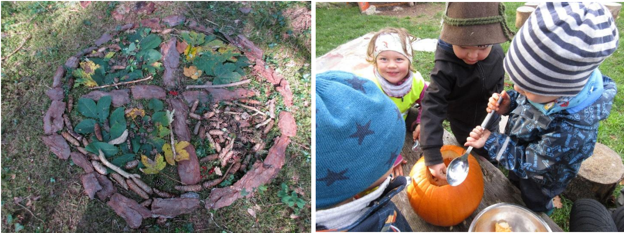
Jahresrad (links), Kürbisschnitzen zu Halloween (rechts)

Die Geburtstage möchten wir nach dem keltischen Baumkalender feiern. So wird dem jeweiligen Geburtstagskind an seinem Geburtstag „sein“ Baum vorgestellt und es wird gefeiert. Die Kinder lernen nebenbei die Vielfalt unserer Bäume kennen.