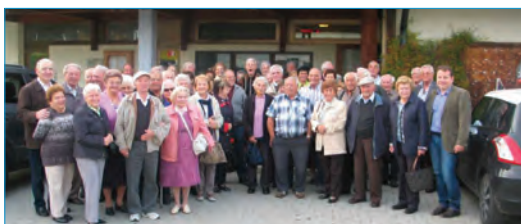
Unsere rüstige Reisegruppe.

65 rüstige Thüringerinnen und Thüringer folgten der Einladung der Gemeinde zum traditionellen Ausflug der über 70-Jährigen. Ein tolles Programm in der Gemeinde Buch war vorbereitet. Bei schönstem Herbstwetter ging die Fahrt mit einem modernen Reisebus