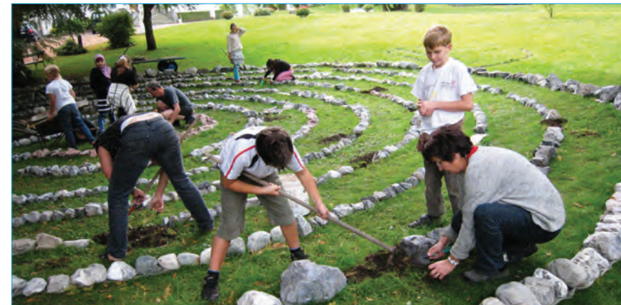
Die Steine sind ausgelegt, das Labyrinth wird bepflanzt.

Seit Kurzem ladet ein 15 m breites, kretisches Steinlabyrinth im Park der Villa Falkenhorst zum Begehen ein. Dieser besinnliche Ort wurde von der Gartenprojektgruppe der Musikvolksschule Thüringen aufgebaut, die dabei vom Obst- und Gartenbauverein Thüringen tatkräftig unterstützt wurde. Die Steine vom inzwischen abgeschlossenen Kunstprojekt fanden dort eine neue Bestimmung.