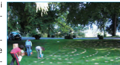
Das Labyrinth wird vermessen und markiert.