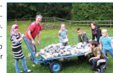
Mit viel Spaß werden die Steine transportiert.