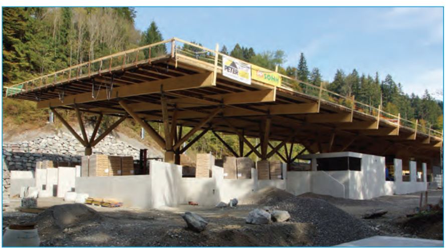
Das Dienstleistungszentrum Blumenegg im Rohbau.