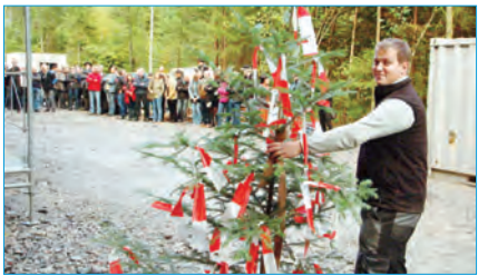
Der Firstbaum wird gehisst.