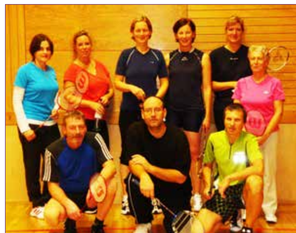
Teilnehmer des Anfängerkurses der Saison 2012/2013

Nach dem Erfolg des Vorjahres organisieren wir auch diesen Herbst wieder einen Badmintonkurs für Hobbyspieler. Dieser richtet sich nicht nur an Anfänger sondern