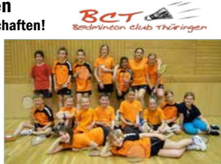
Die Teilnehmer der Schüler-Vereinsmeisterschaften

Bei den vor kurzem abgehaltenen Vereinsmeisterschaften des Badmintonclubs Thüringen konnte speziell der Nachwuchs heuer mit einem Rekord-Teilnehmerfeld auf sich aufmerksam machen. Insgesamt nahmen 16 Schülerinnen und Schüler die Gelegenheit wahr, sich in Spiel & Spaß mit den Vereinskollegen wettbewerbsmäßig zu messen. Die Spitzenspiele um die vorderen Plätze waren auch heuer wieder heiß umkämpft.