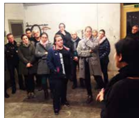
Die Gemeindevertreter und Landesrat Ing. Erich Schwärzler machten sich persönlich vor Ort ein Bild von der Unterbringung der Flüchtlingsfamilien