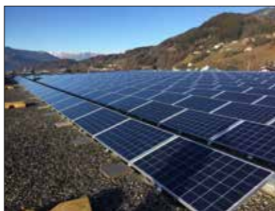
fertige PV-Anlage auf dem Dach der MMS-Thüringen

Aktion gültig solange der Vorrat reicht.