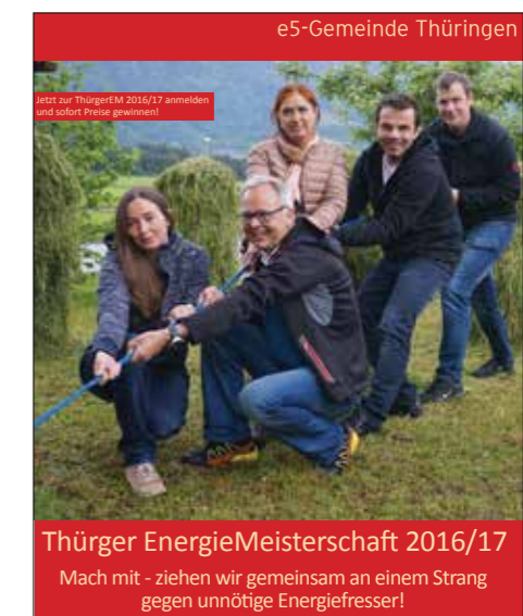
Thürer EnergieMeisterschaft 2016/17 Mach mit - ziehen wir gemeinsam an einem Strang gegen unnötige Energiefresser!

Die Montjolaquelle liefert uns Thürer und Thürerinnen eine sehr hohe Qualität an Wasser.