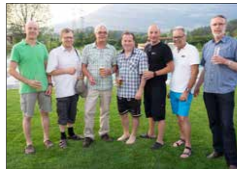
Die Thüriger Gemeindevertreter bei der Eröffnung des Walgaubades

Das sanierte und ausgebaut Walgaubad in Nenzing wurde am Freitag, 3. Juli offiziell eröffnet. Alle 14 „Regio Im Walgau“-Gemeinden haben sich an diesem Projekt