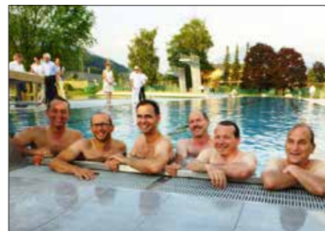
LH Wallner und die Bürgermeister testeten das Walgaubad persönlich

finanziell beteiligt. Die Gesamtkosten belaufen sich auf rund sechs Millionen Euro, mehr als 1,8 Millionen Euro kommen von Landesseite. „Die neue Bäderkooperation ist ein Vorzeigeprojekt für gemeindeübergreifende Zusammenarbeit“, betonte Landeshauptmann Markus Wallner in seiner Begrüßung. Die Angebote in Sachen Freizeit, Erholung und Kultur attraktiv und leistbar zu halten – dieses Ziel haben sich die 14 Walgau-Gemeinden gesteckt. Wie das funktionieren kann, machen sie mit dem landesweit ersten regionalen Bäderprojekt vor. An den Kosten für Sanierung und Ausbau des Freibades haben sich alle Gemeinden der Regio beteiligt. Gemeinschaftlich finanziert werden in Zukunft außerdem das Freibad in der Felsenau und das Naturbad in der Unteren Au in Frastanz. Gemeindefinanzierung wird stark forciert. „Statt ‚Inselösungen‘ Kooperationspotentiale auszuloten und aktiv